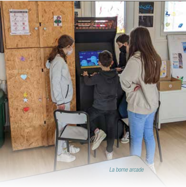
La borne arcade