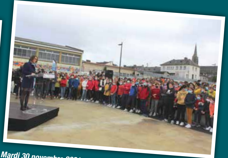
Mardi 30 novembre 2021 Inauguration du nouveau collège François Clec'h