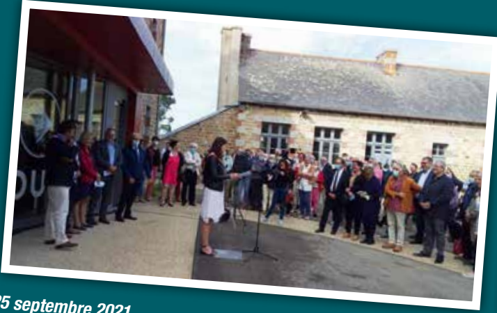
25 septembre 2021 Inauguration de la médiathèque "La page en cours"