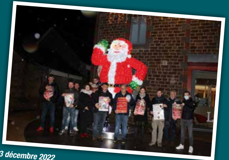
3 décembre 2022 Présentation des animations et opération commerciale de l'association Bégard Cap de ville en partenariat avec la ville