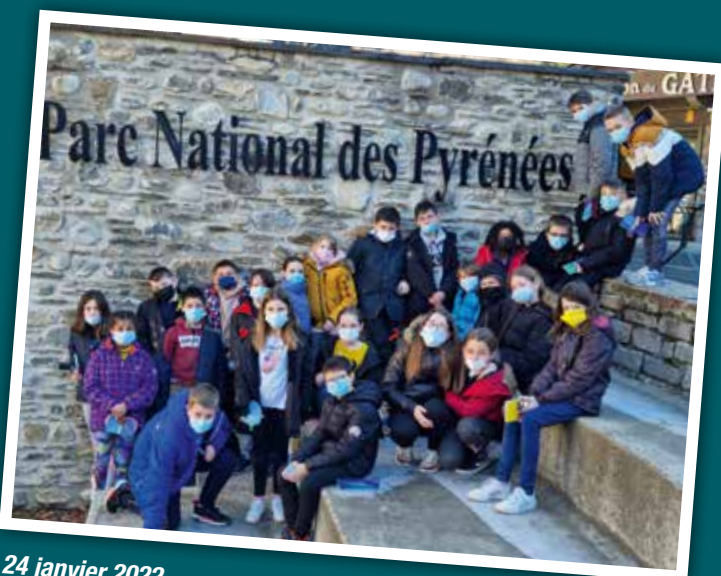
24 janvier 2022 Classe de neige des CM2 de l'école Noël Bernard à St Lary Soulan