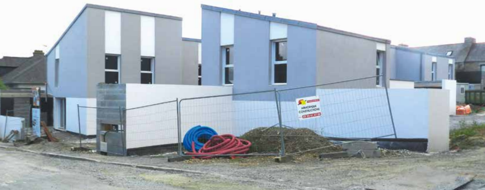
Construction de logements neuf rue Joliot Curie